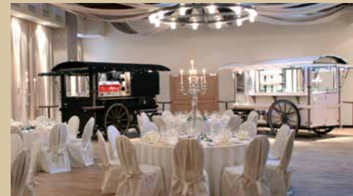
Champagnerwagen und Kaffeewagen im Kloster-Saal