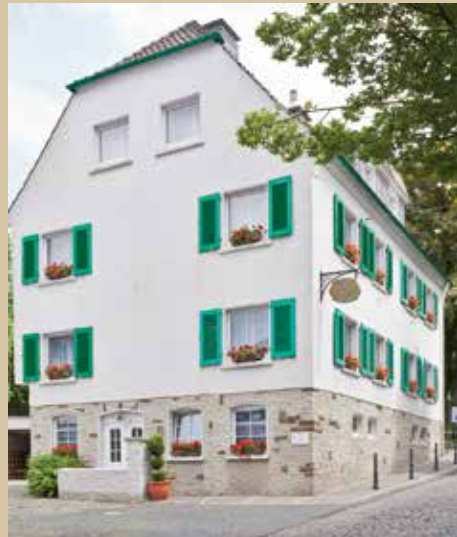
Gästehaus „Alte Schule“

Ob dieses Gebäudes einst wirklich das alte Schulhaus war, konnte urkundlich nicht in Erfahrung gebracht werden, aber der Gedanke liegt nahe.