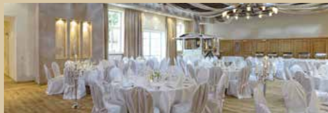
Unser Schmuckstück – der Kloster-Saal