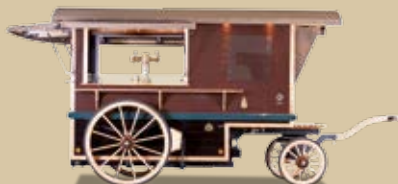
Cocktail- und Longdrinkwagen