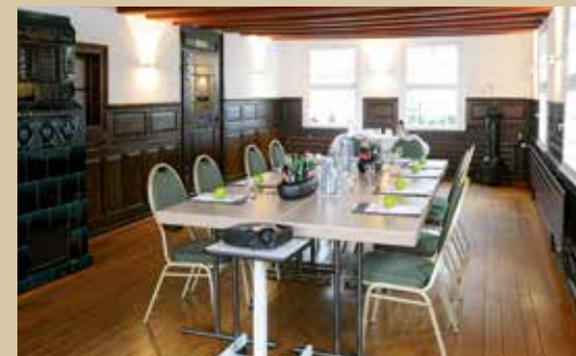
Hotel zur Post