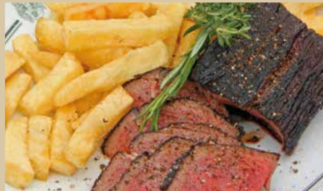
Steak vom Galloway aus hauseigener Zucht