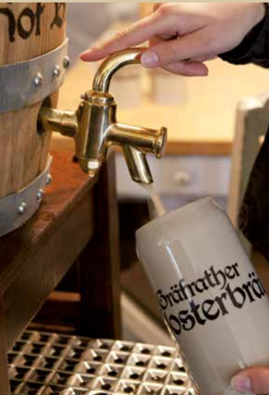
Klosterbräu Biere: Pils, Rheinisches Alt, Zwickel

Wir freuen uns auf Ihre Meinung und Ihr Feedback, denn nur so erfahren wir, ob wir auf dem richtigen Weg sind, Ihnen Freude zu bereiten. Gastlichkeit von Herzen!