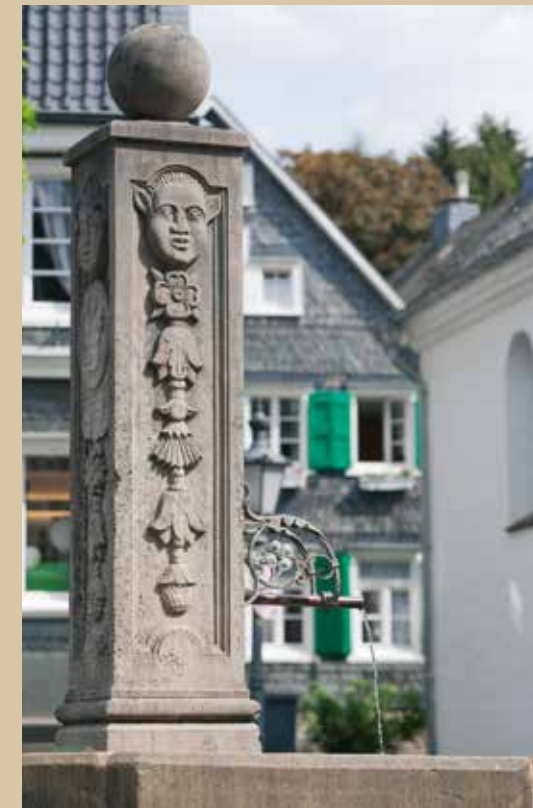
Brunnen auf dem Marktplatz Solingen-Gräfrath