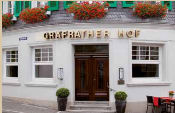
Hotel Gräfrather Hof

Sie haben zusätzliche Wünsche? Laktose- oder glutenfreie Kost halten wir auf Anfrage selbstverständlich für Sie bereit.