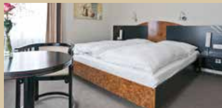
Doppelzimmer Gästehaus „Alte Schule“