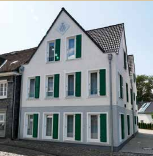
Boarding-House „In der Freiheit“

Der Hotelparkplatz liegt zu Füßen des Boarding-Houses. Von dort ist auch der Fahrradkeller ebenerdig zu erreichen. Hier haben wir insbesondere an die Gäste gedacht, die ihren PKW stehen lassen möchten und aufs Fahrrad wechseln, um zum Einkaufen, zur Arbeit oder auf eine Fahrradtour aufzubrechen.