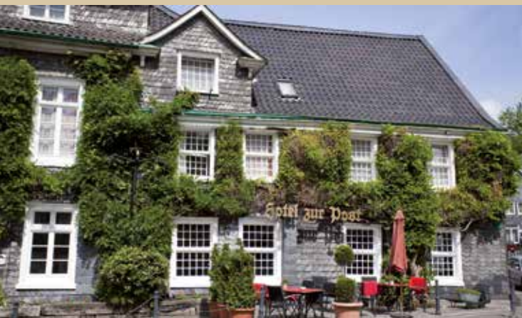
Hotel zur Post

Jedes Zimmer ist durch den Erhalt des Fachwerks individuell geschnitten, kein Zimmer gleicht dem anderen, was jedem Zimmer eine sehr interessante Note gibt.