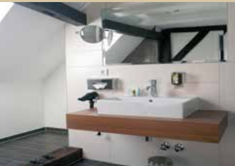
Bad Hotel zur Post