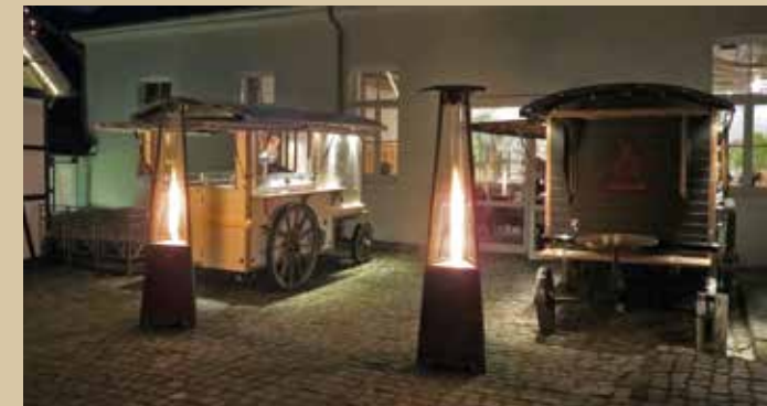
Champagnerwagen und Kaffeewagen outdoor