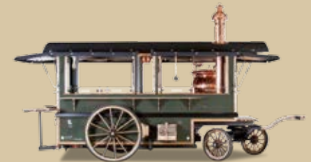
Feuerzangenbowlen/Glühwein- und Suppenwagen