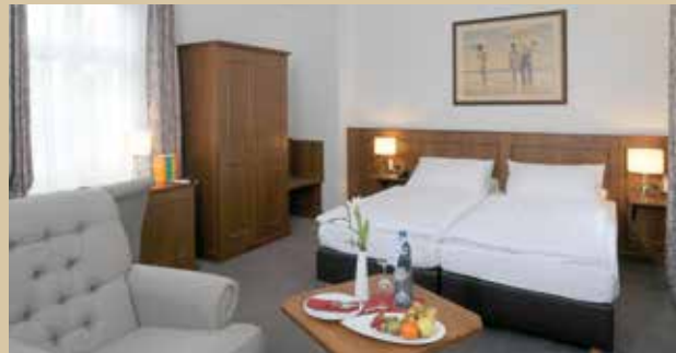
Doppelzimmer Hotel zur Post