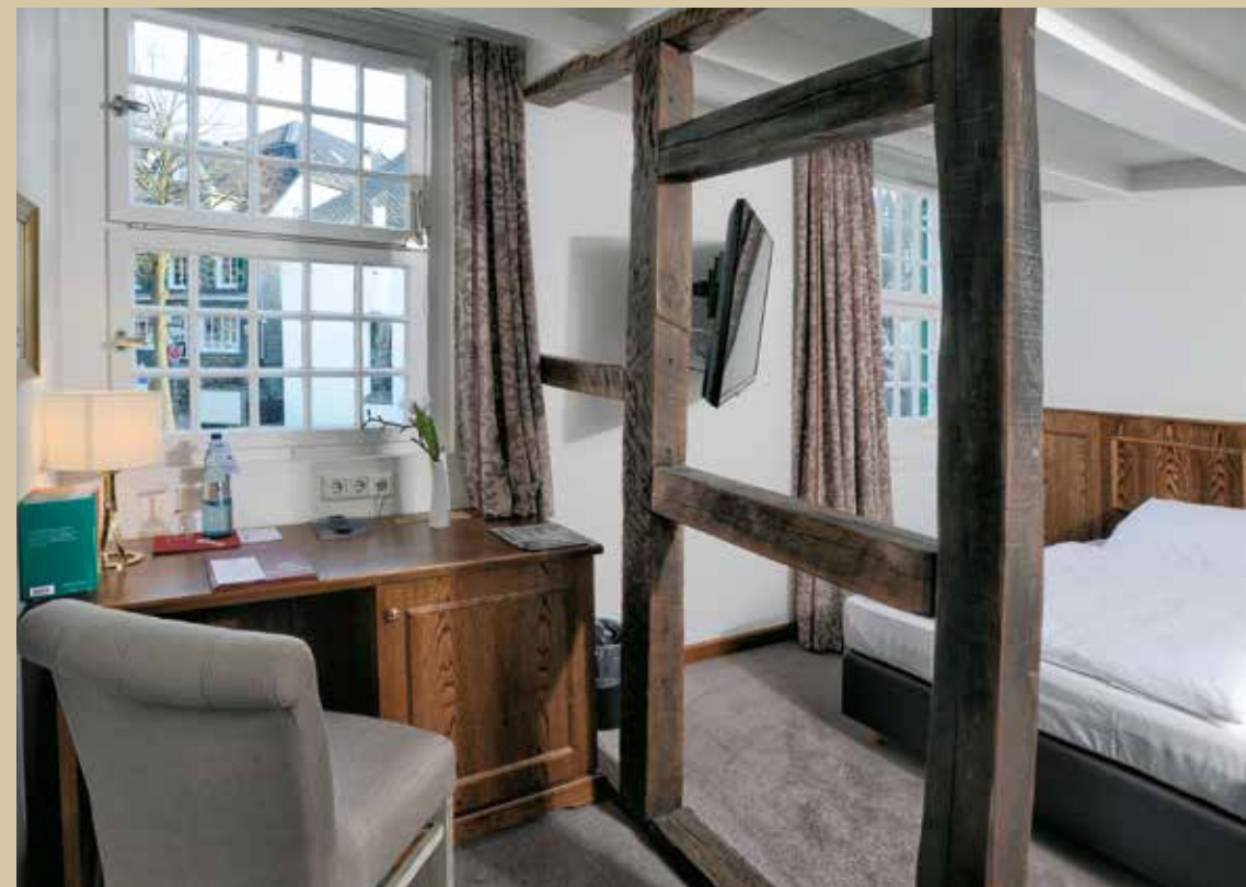
Einzelzimmer Hotel zur Post