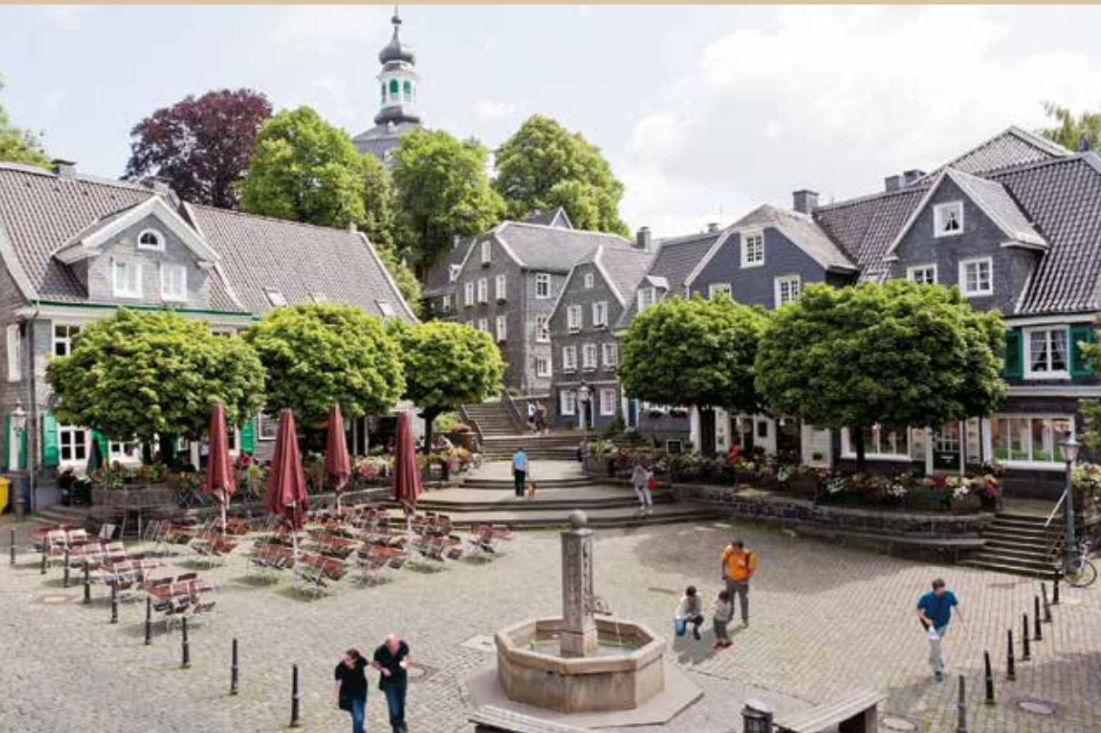
Historischer Marktplatz Solingen-Gräfrath

Wir beraten Sie individuell und garantieren Ihnen schöne Tage und Nächte im historischen Solingen-Gräfrath.