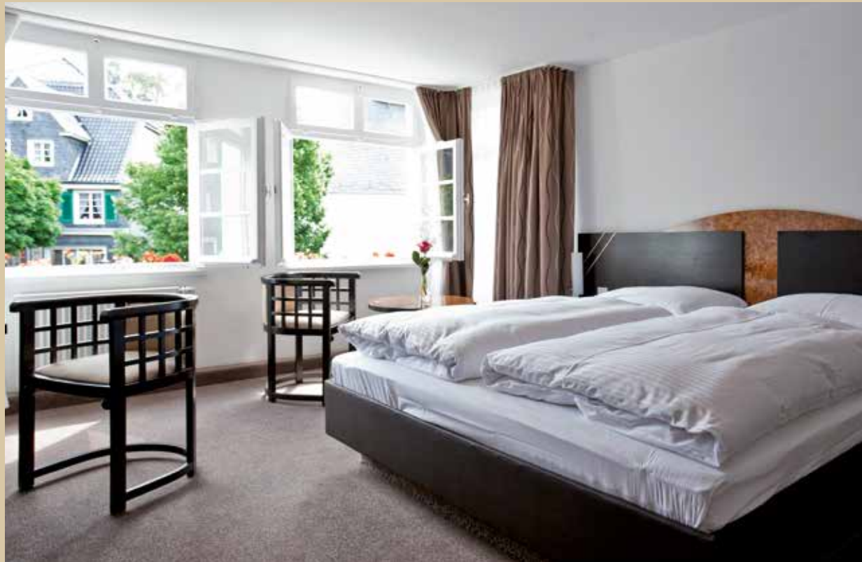
Doppelzimmer Gästehaus „Am Markt“

Es befindet sich direkt am historischen Brunnen. Jeden Sommer schmücken rote Geranien die mit grünen Schlagläden versehenen weißen Sprossenfenster. Es macht einfach Freude, dem bunten Treiben auf dem Marktplatz zuzusehen.