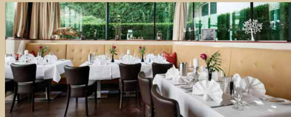
Café FLORIAN Wintergarten