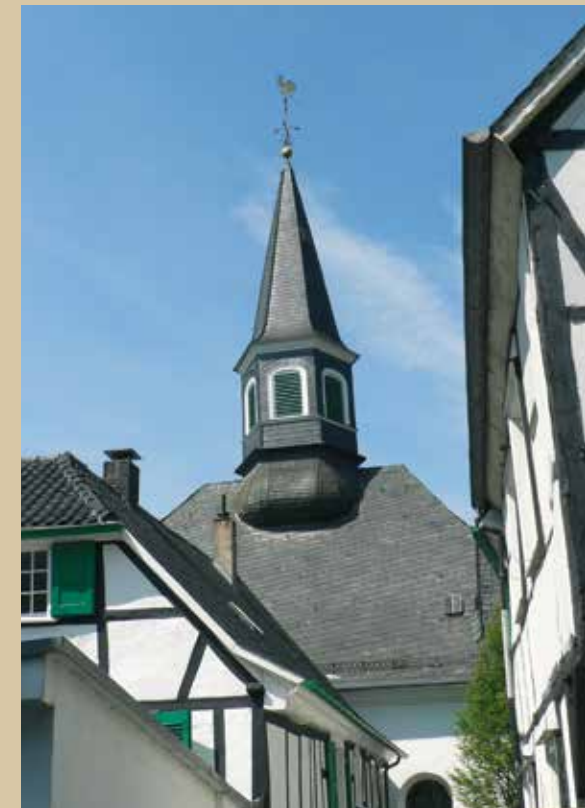
Impressionen von Solingen-Gräfrath und Umgebung