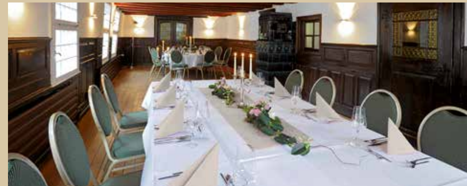
Hotel zur Post