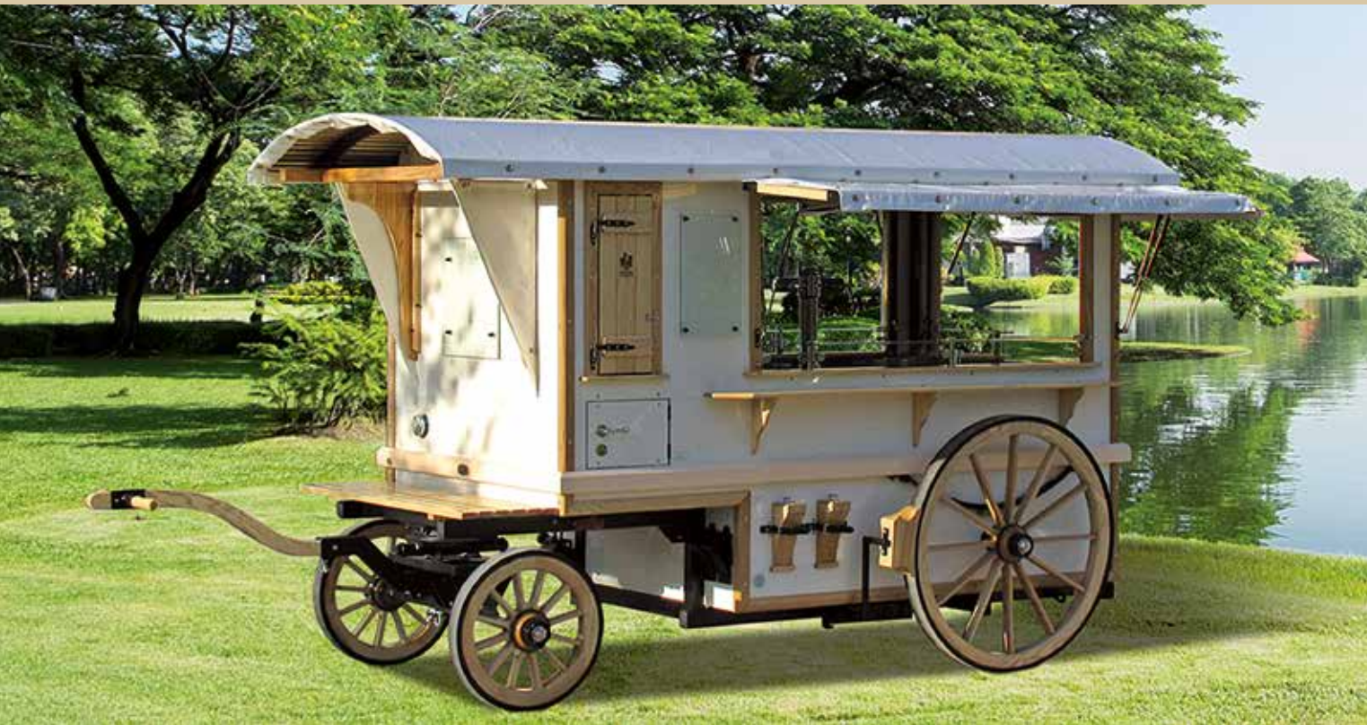
Champagner- und Hochzeitswagen

Für das Dessert einen Eiswagen? Digestifwagen mit Zigarren und Rum? Feuerzangenbowle oder die klassische Gulaschkanone mit schmackhaften Eintöpfen? Für uns eine Freude! Wir leben Catering und liefern ein Gesamtpaket vor Ort. Egal ob zu Firmenevents, Geburtstagen im Garten oder Hochzeiten an besonderen Locations. Wir kommen zu Ihnen und bewirten Ihre Gäste mit Spitzenprodukten den ganzen Tag.