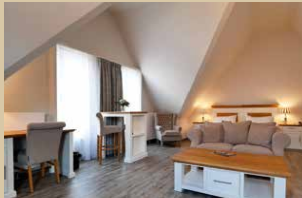
Wohn- und Schlafbereich