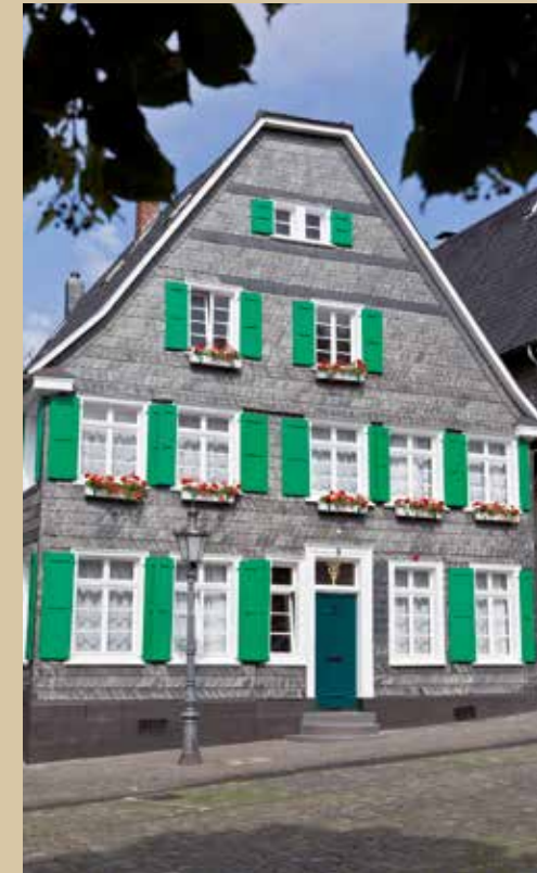
Gästehaus „Am Markt“