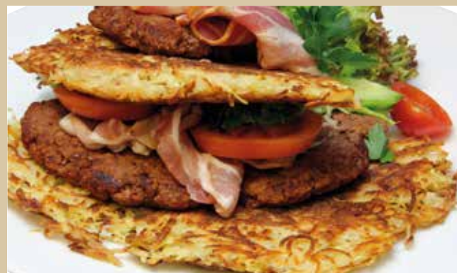
Spezialität des Hauses – Der Kloster-Burger