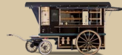
Digestif- und Zigarrenwagen