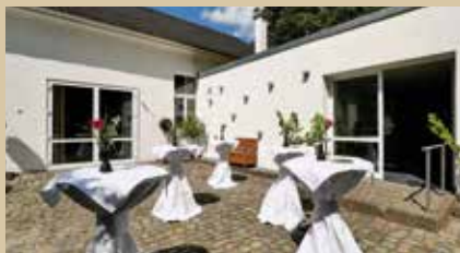
Kloster-Saal Innenhof und Eingang