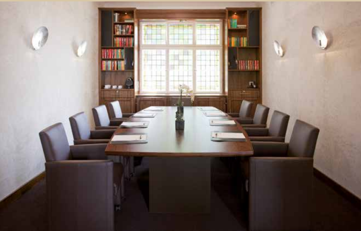
Bibliothek Hotel Gräfrather Hof

Wir garantieren Ihnen einen professionellen Service.